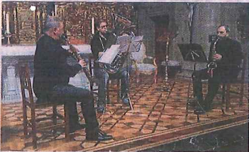
Los componentes de Amalgama en una actuación anterior.