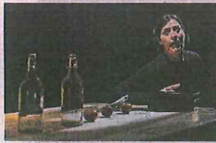
Teatro Apolo. 'Bodas de sangre'.